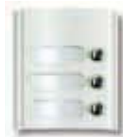
Art. 8A53 Modul mit 3 Ruf Tasten