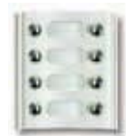
Art. 8A48 Modul mit 8 Ruf Tasten in 2 Reihen