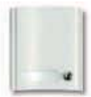
Art. 8A51 Modul mit 1 Ruf Taste