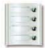
Art. 8A54 Modul mit 4 Ruf Tasten