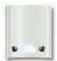
Art. 8A42 Modul mit 2 Ruf Tasten in 2 Reihen