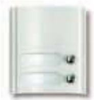
Art. 8A52 Modul mit 2 Ruf Tasten