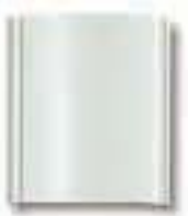
Art. 8000 Blindmodul

Farben: Lichtgrau (Standardfarbe, z. B. Art. 8000), Weiß (./17, z. B. Art. 8000/17), Anthrazitgrau (./21, z. B. Art. 8000/21), Strukturgrau(./35, z. B. Art. 8000/35) Material lackiertes Aluminium und Copolymer Beleuchtung des Namensschilds: mit grünen LED's Abmessungen: 97x111mm