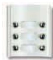
Art. 8A46 Modul mit 6 Ruf Tasten in 2 Reihen