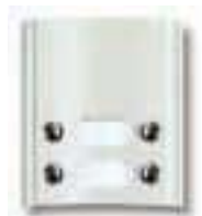
Art. 8A44 Modul mit 4 Ruf Tasten in 2 Reihen